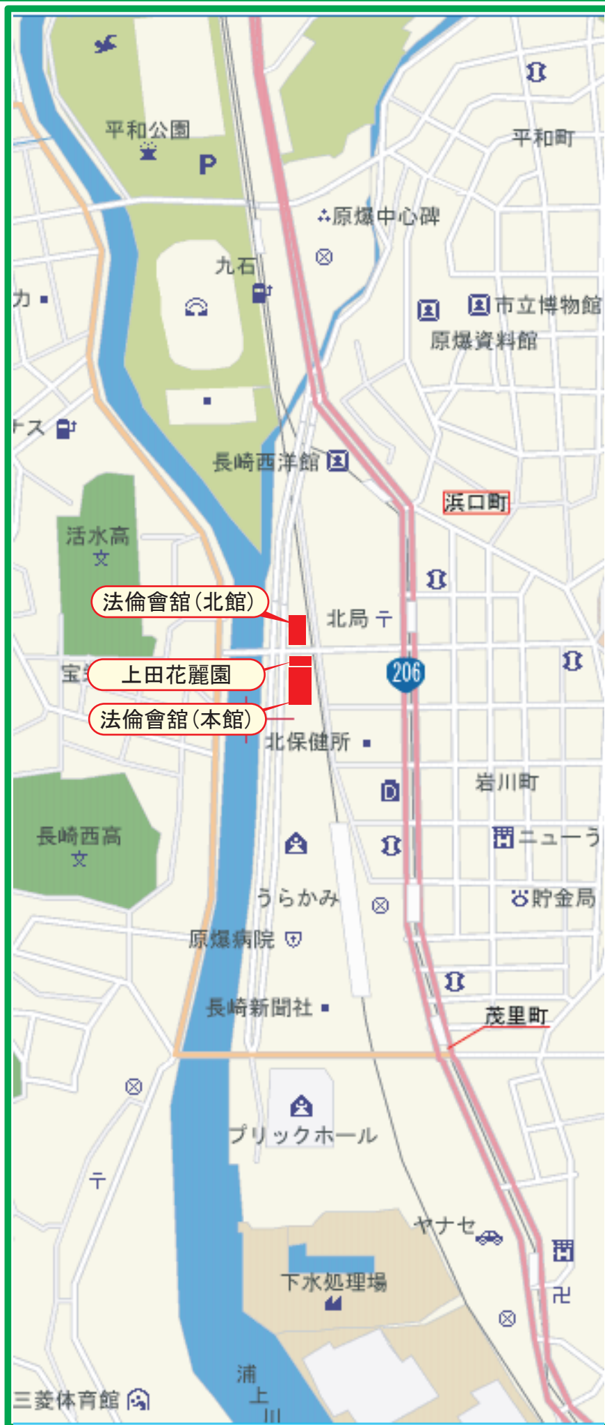
長崎法倫會館(本館、北館)